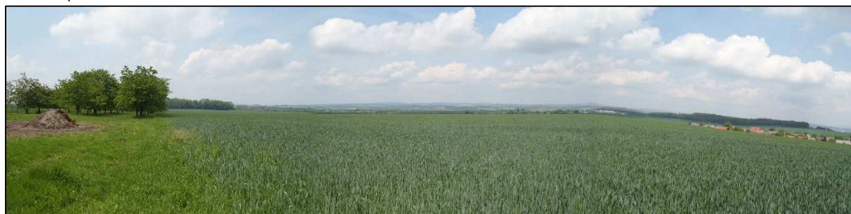
Pohled na polní okrsek nad Velkou Jesenicí